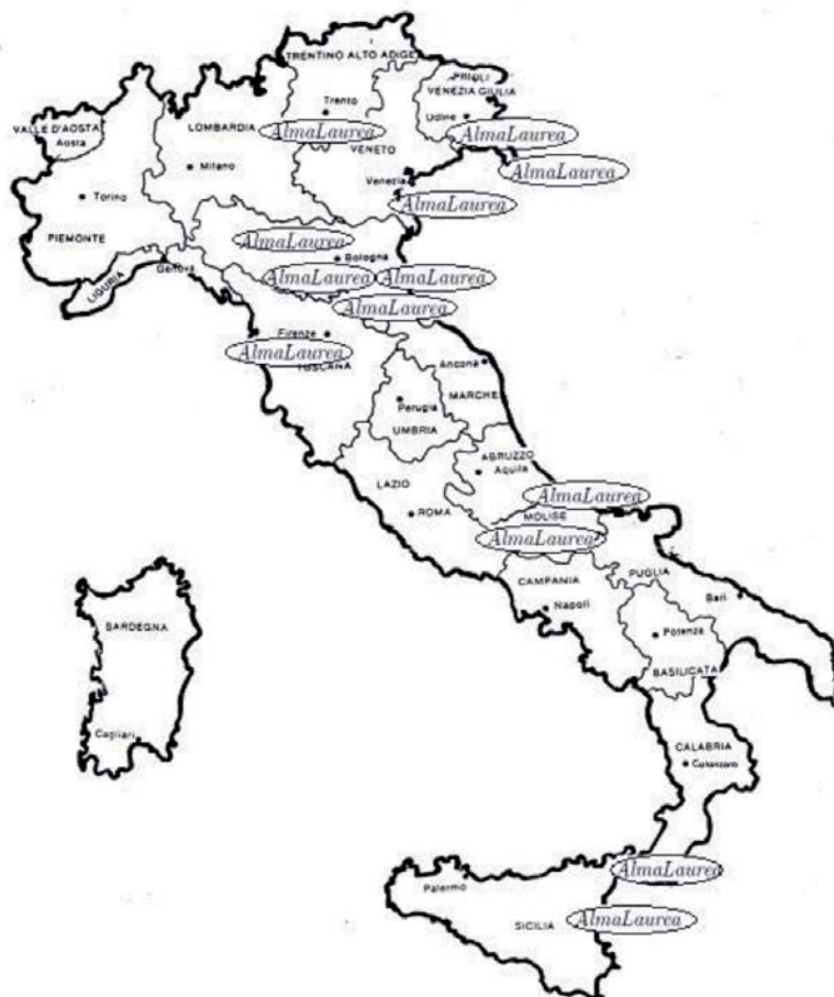
FIG. 5.1. Le università che hanno aderito ad AlmaLaurea fra il 1995 e il 1998.

Oggi il consorzio è formato circa 40 università, sia pubbliche che private, ma fino al 1998, anno come risulterà chiaro più avanti cruciale per le caratteristiche dei nostri dati, solo 12 università facevano parte di AlmaLaurea: Bologna, Catania, Chieti, Ferrara, Firenze, Messina, Modena, Molise, Parma, Trento, Trieste e Udine. Da tali università, comunque, proviene una quota non marginale, circa il 22%, dei laureati italiani e come mostrato nella figura 5.1 tali università sembrano essere ben distribuite sul territorio nazionale.